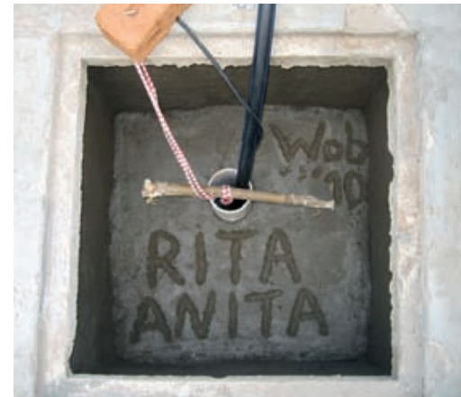
Numele în placa de beton a fântânii.

Am reconstruit complet satul de copii din Mdeka. De aceea, nimeni din sat nu