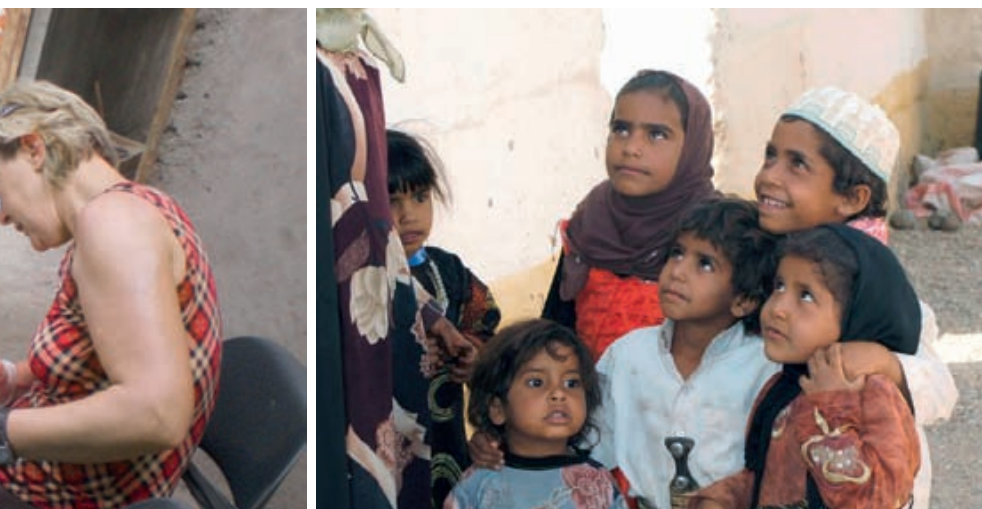
Copii din Yemen.