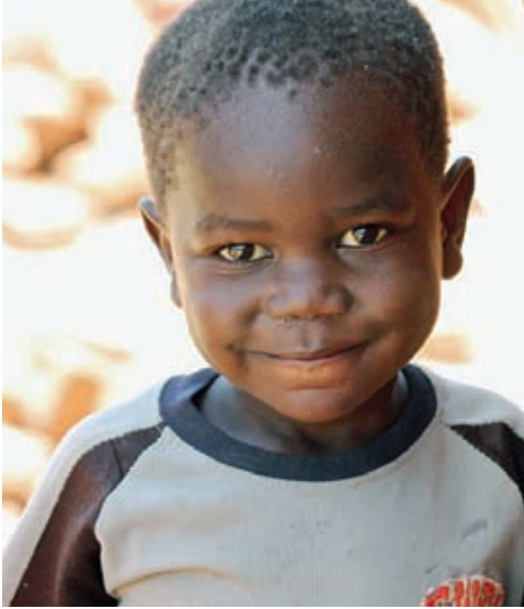
Blessings după ce a fost luat în satul de copii.